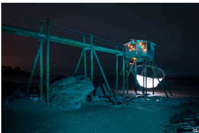
Territoires imaginaire

Ce lieu scénographié offre également des projections, spectacles, concerts et la possibilité de boire un verre et de se restaurer à partir de produits locaux ou issus de l'agriculture biologique.