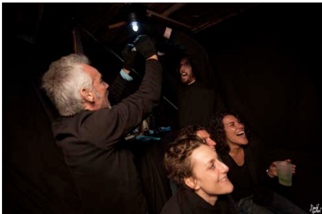
Théâtre Cabine

A la nuit tombée, créations lumineuses et sonorités abyssales vous offriront un moment de contemplation poétique sur toute la côte.