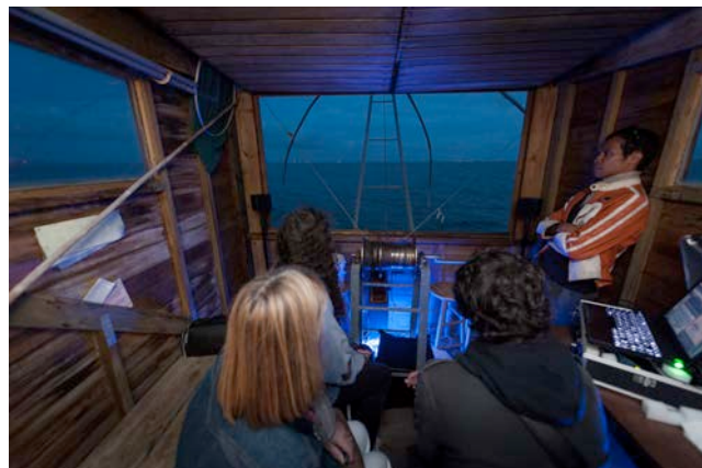
Installation sonore