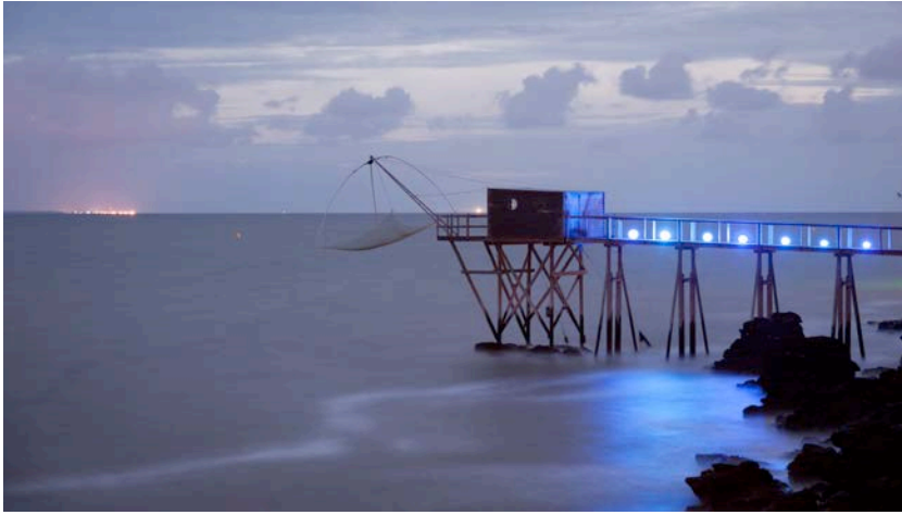
Installation Philippe Arbert